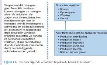
Figuur 1.6 De onderliggende activiteiten bepalen de financiële resultaten