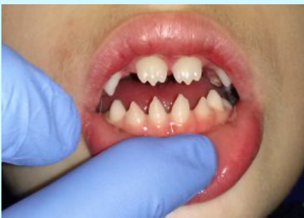
Sífilis congénita tardía