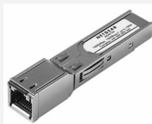
module - SFP Cuivre