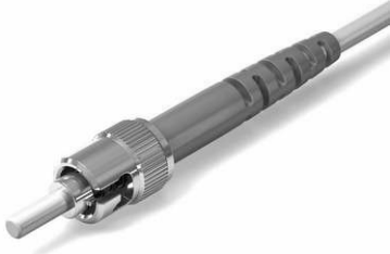
Terminaison Optique - ST