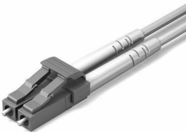
Terminaison Optique - LC