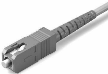
Terminaison Optique - SC