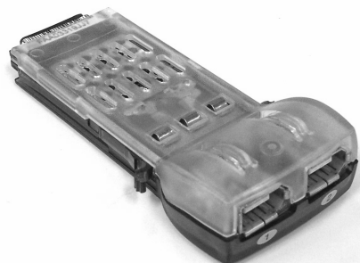
Module - GigaStack